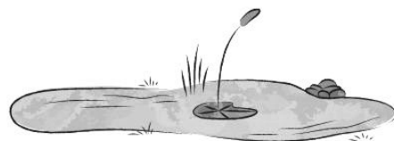
STAWY I JEZIORA