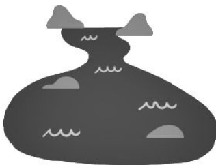
WOLNO PŁYNAĆE RZĘKI