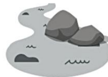
RZEKI I JEZIORA