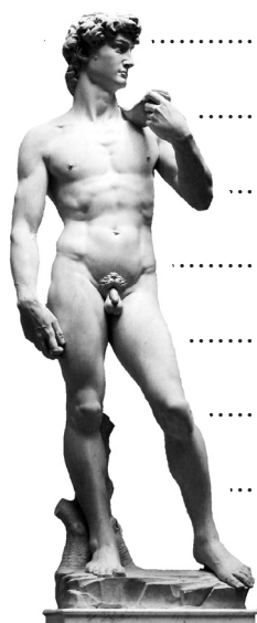
Michał Anioł, Dawid

7. Napisz, w jaki sposób poniższe dzieła nawiązują do antyku.