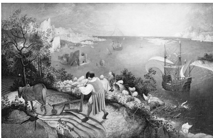
Pieter Breughel Starszy Pejzaż z upadkiem Ikara