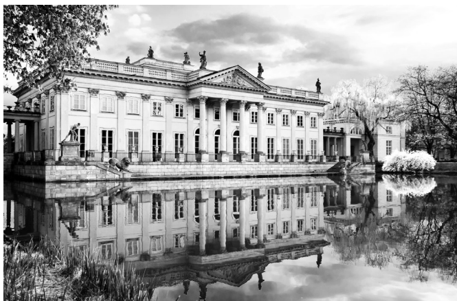
Pałac na Wodzie w Łazienkach