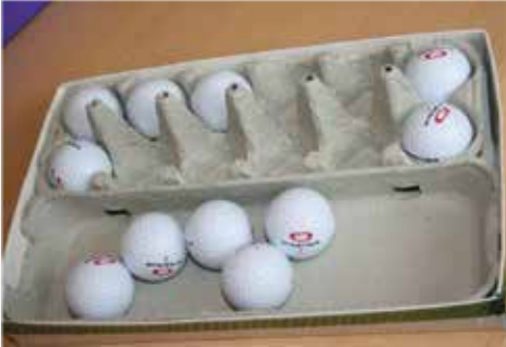
версія на 6 штук