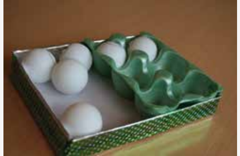
версія на 12 штук