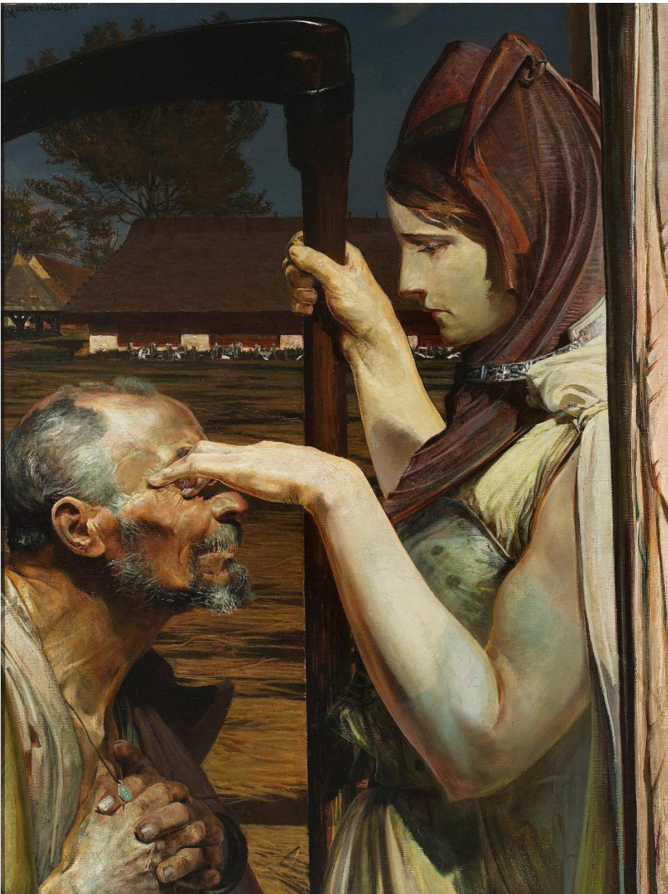
Jacek Malczewski, Śmierć (1902)

Przyjrzyj się poniższemu obrazowi. Wybierz nazwę właściwego prądu artystycznego, następnie uzasadnij swój wybór, formułując jeden argument.