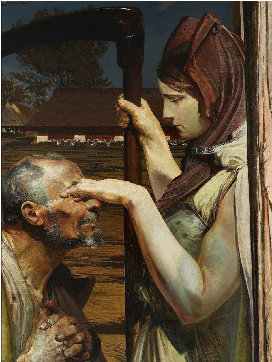
Jacek Malczewski, Śmierć (1902)

Przyjrzyj się poniższemu obrazowi. Wybierz nazwę właściwego prądu artystycznego, następnie uzasadnij swój wybór, formułując jeden argument.