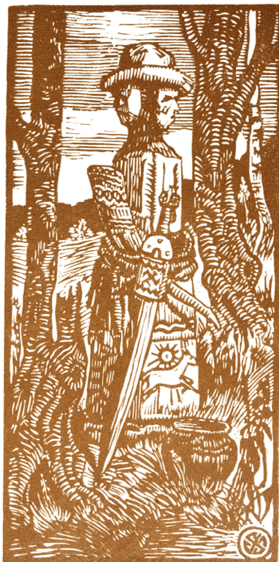
Stanisław Jakubowski, Światowid , 1923, grafika, papier, drzeworyt barwny.

Możecie także obejrzeć w internecie grafiki Aleksa Fantalowa i Andrieja Klimienki oraz przejrzeć następujące opracowania: