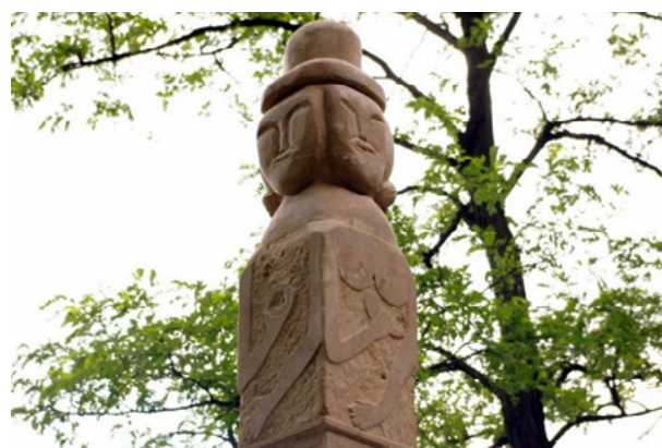
Na zdjęciach posąg Światowida w parku Alfreda w Czeladzi.