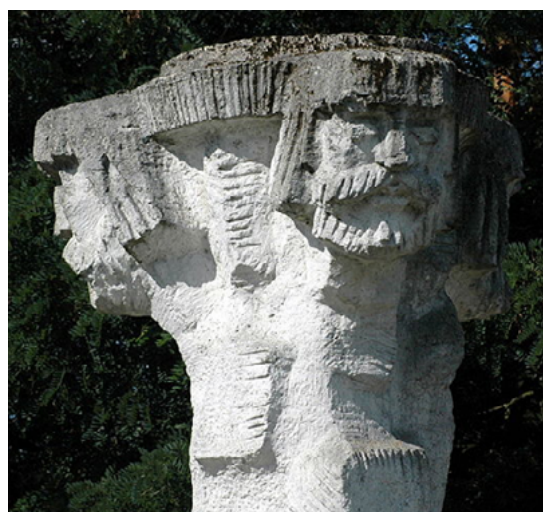
Na zdjęciach figura Trygława w parku miejskim w Wolinie. Fot. Radosław Drożdżewski