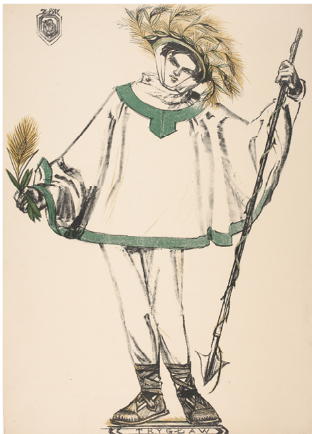
Zofia Stryjeńska, Tryglaw , 1917, karton, litografia barwna. Fot. Piotr Ligier

2. Tematyka związana z mitologią Słowian była i jest do dziś źródłem natchnienia dla wielu artystów. Domyśły na temat wierzeń rozpałały wyobraźnię pisarzy i malarzy, inspirowały do tworzenia fantastycznych opowieści i innych dzieł.