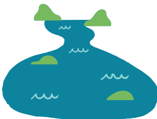
WOLNO PŁYNAĆE RZEKI